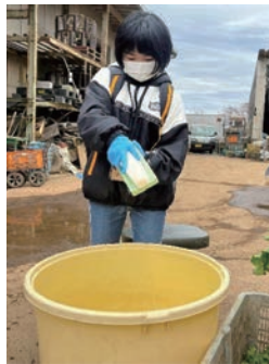
き切り干し大根や干し芋へ加工