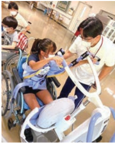
ふくし かいごせつ けんがく 福祉・介護施設の見学