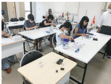
ドローンを分解して仕組みを理解しよう！