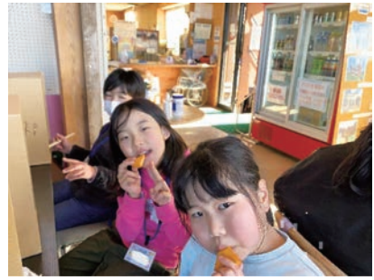
奥日立ぎららの里で燻製づくり体験