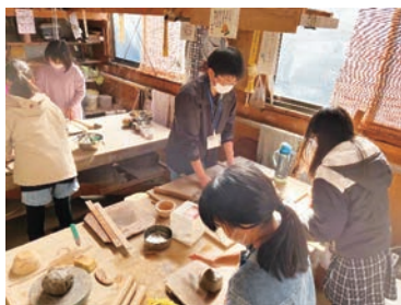
みんなで陶器をつくろう！ どんな器をつくろうかな？