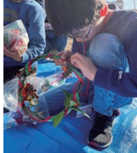
クリスマスリース作り (助川山市民の森)