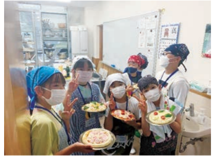
たかはら自然塾でピザづくり体験