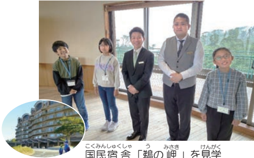
こくみんしゆくしゃう きやう みきき けんがく 国民宿舎「鷗の岬」を見学 人気の秘訣や魅力は？