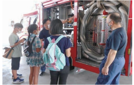
ひたちしやうぼうほんぶ しごと ようす さまざま しゆらい 日立市消防本部で、仕事の様子や様々な種類の 消防車を見学