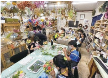
お花屋さんでフラワーアレンジメント体験！

基礎学習では、お店のしくみや仕事について、話し合いやゲームなどの形式で学びます。その他に体験学習では、商品のこだわりやお客さんへの思いなどを聞いたり、普段は見られないお店の奥を見学したりなど、様々な体験を通して商業について学びを深めることができます。