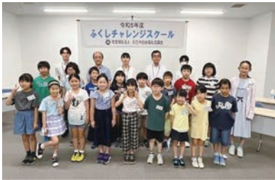
ふくし かいご いりょう かつどう 福祉、介護、医療やボランティア活動 について学ぶよ！

また、福祉・介護施設、病院などを訪問し、実際のような様子を見学するなど、福祉・介護・医療などの仕事への理解を深めます。