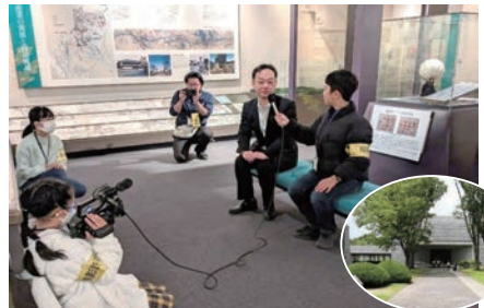
ひんりつれきしかん けんがく いばらき れきし がくしゆ 県立歴史館を見学し、茨城の歴史の学習 取材体験も！