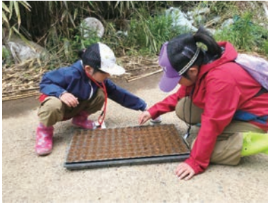
とうもろこしの種植