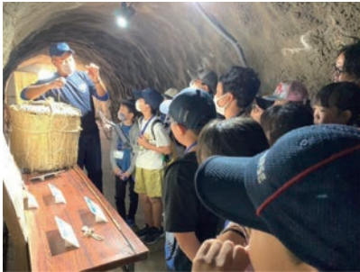
ウミウ捕獲場の見学