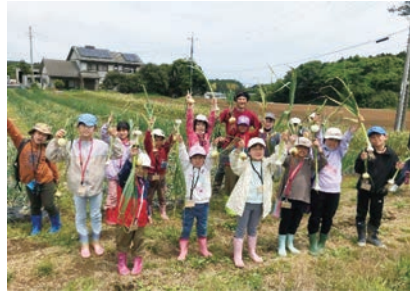
たまねぎ、にんにくの収穫