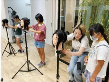
美容室でヘアアレンジ体験！