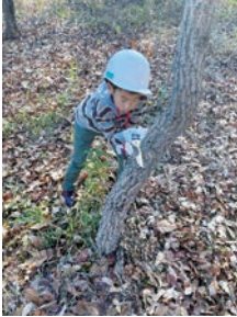
間伐つ体験 (助川山市民の森)

助川山での間伐つや植樹などの体験、昆虫採集や水辺の生き物の観察、クリスマスリース作りや巣箱作りなどの木工体験をします。また、夏には、木材加工関連の工場などの見学も行います。