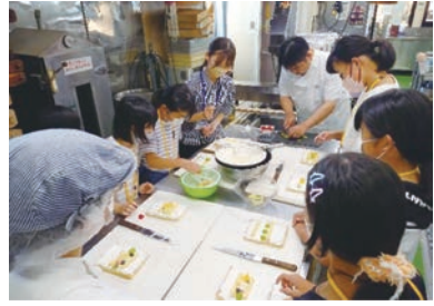
ケーキ屋さんでロールケーキ作り体験！