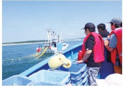
シラス船曳網漁を間近で見学！