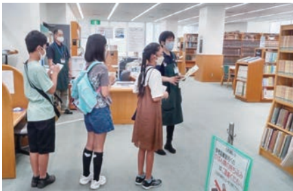
ひたちしりつきねんとしやうかん 日立市立記念図書館では、バックヤードと言われる ふだん見られない場所も見学！