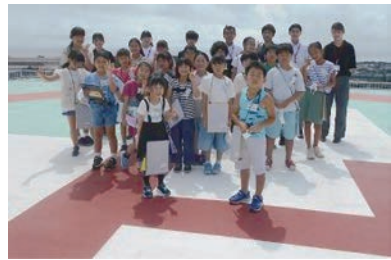
びょういん きゅうめいきゅうきゅう はなし 病院で救命救急についてのお話 を聞いたり院内を見学したりするよ！