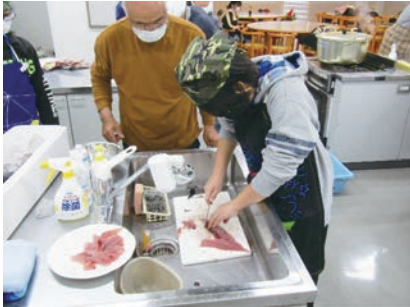
漁師さん直伝の魚のさばき方教室！