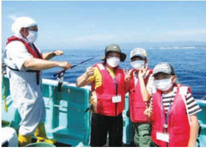
漁船に乗って釣り体験！

海や魚のことについて、現役の漁師さんなどの“その道のプロ”からたくさん学びましょう！