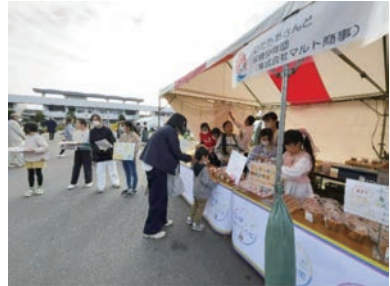
スーパーマルトさんのご協力のもと、団員が考えた商品を日立市産業祭で販売体験！