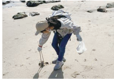
かつどう かいがんせいそう ボランティア活動（海岸清掃）