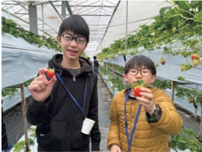
いちご狩り・干し手作り体験

しないとくさんひん まな とぎ じっしょく りかい ふか しないかんこうしせつ しょういんたいげん さまざま かつどう 市内特産品を学び、時には実食し理解を深めます。また、市内観光施設の職員体験など、様々な活動を行います。