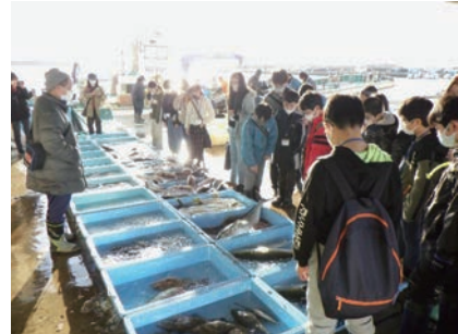
県内唯一の定置網漁の水揚げを見学！