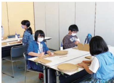
ダンボールを使って工作体験！ イスを作ってみよう！

ひたちで活躍するものづくりに係わる皆さんに教えてもらいながら、手作りの作品を作ったり、見学したり、さまざまな体験をすることができます。みなさんの生活にある「もの」が、どのようにして作られているのか体験しながら学びましょう！