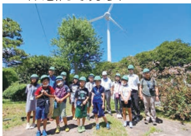
企業の施設を見学！ 身の回りにはどんな施設があるのかな？