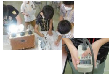
家電品の消費電力を測定。LED電球と白熱球を比べてみよう！