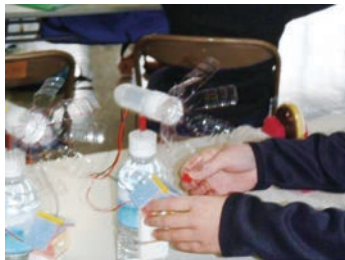
自然エネルギーを利用する風力発電の模型を作ったよ！