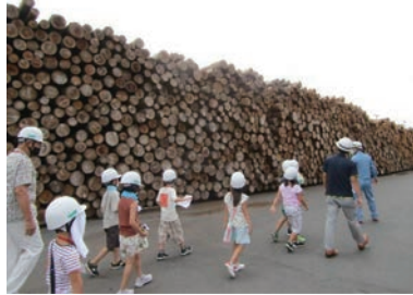
木材関連の工場見学 (常陸大宮市)