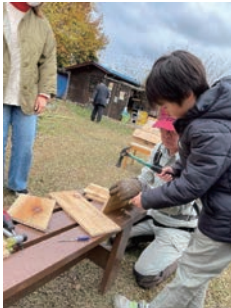
巣箱づくりに挑戦！ (赤羽緑地自然観察ふれあい公園)