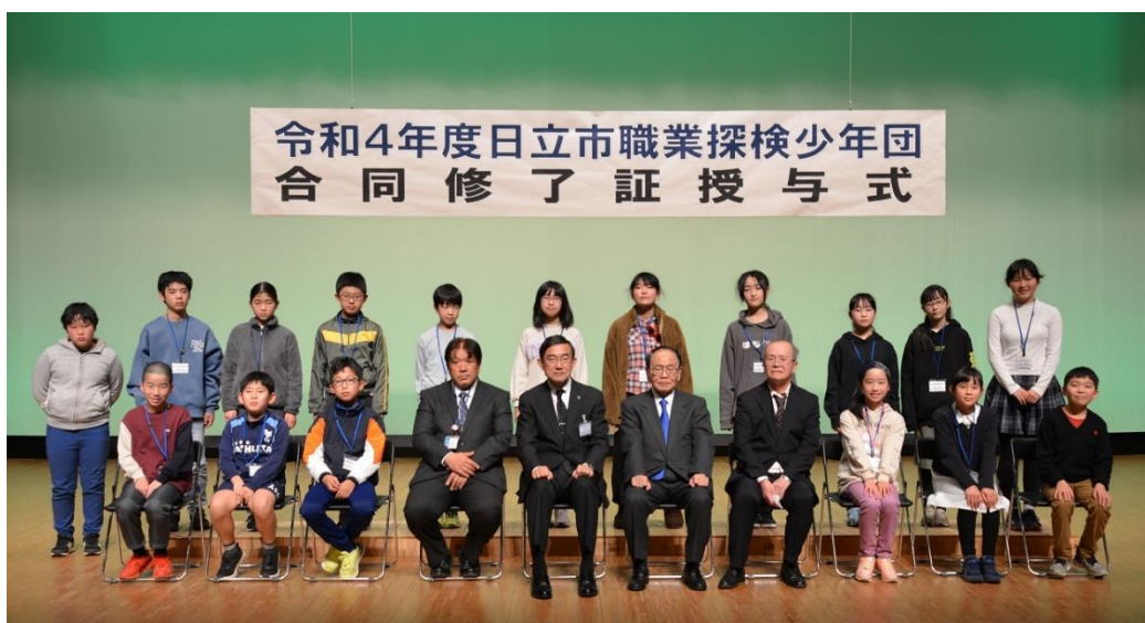
最後に少年団毎に記念写真を撮りました！ 1年間、お疲れ様でした！