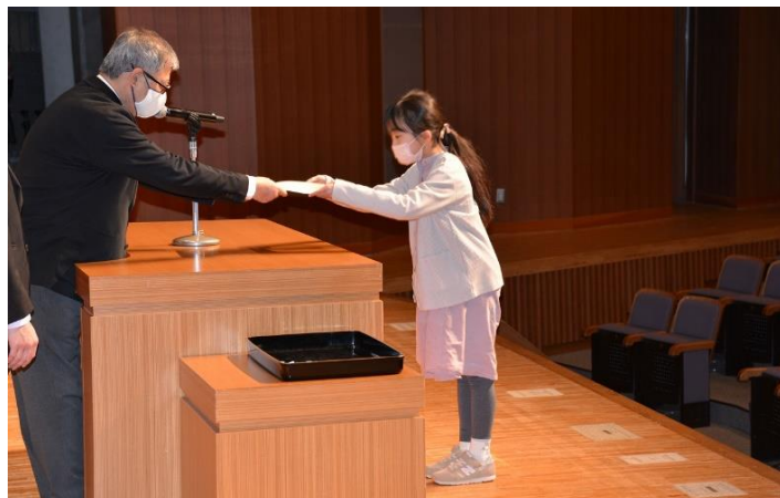
修了証授与式の様子