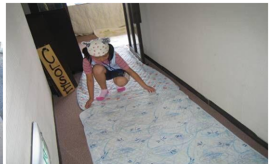
ぬれたまま歩いても大丈夫のように 廊下に布マットを敷いておきます。