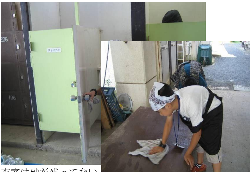
更衣室は砂が残っていない 更衣室もきれいにお掃除をしておきます

海から帰ってのカレーはおいしそうでした。また来年も楽しみにしてきたいと思います。