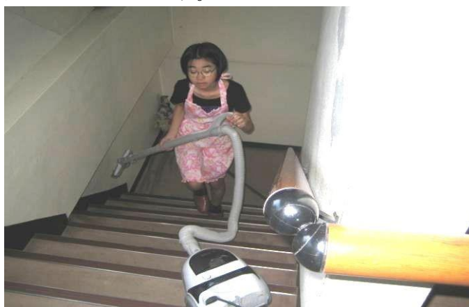
階段のお掃除です。

たくさんの方が上がり降りしている ので小さなごみがあります。「掃除機 のかけ方が上手だね、お家でやって いるのかな」と褒められました。