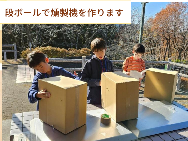
段ボールで燻製機を作ります

奥日立きらの里で、簡単な燻製機の組み立てから 燻製作りを体験し、完成した燻製の試食をしました。