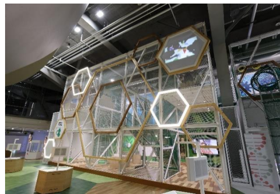
科学体験シヤングル 「ためしてハニカム」