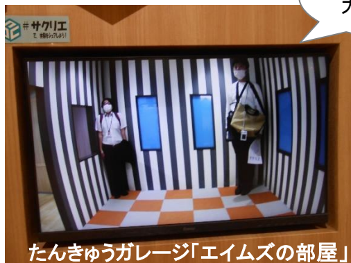
たんきゅうガレージ「エイムズの部屋」