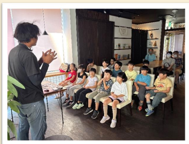
【お米のお話を聞きます】