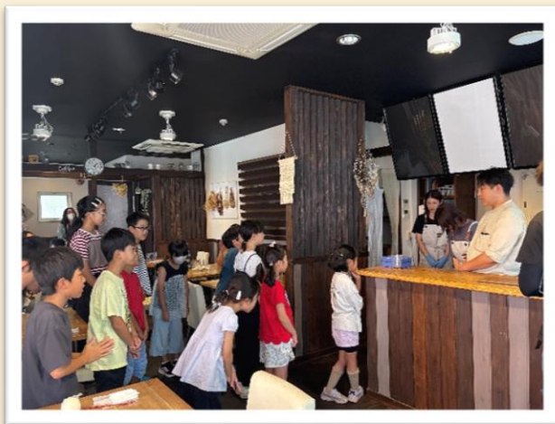
【お世話になったお店の人にお礼を言います】