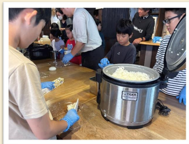
【家族の分も作りました】