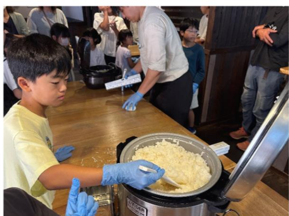
【早速おにぎり作りに挑戦！】