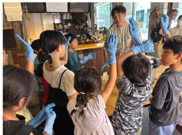
【おにぎり作ったことある人ー！】