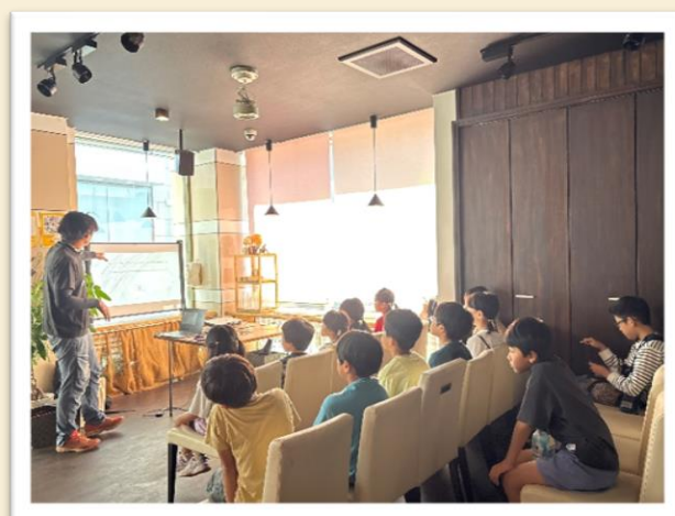
【たくさんの手間がかかっていることが分かりました】