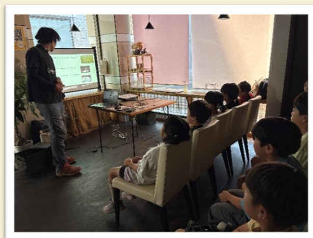
【お米にはどんな種類があるのかな?】