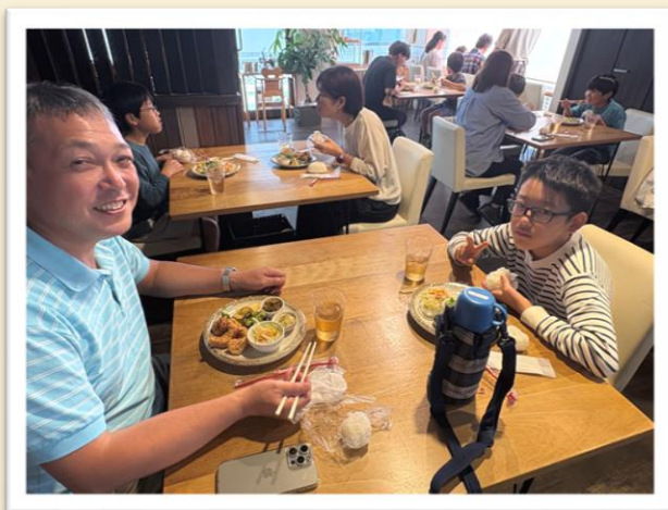
【新米で作ったおにぎりを食べます！】