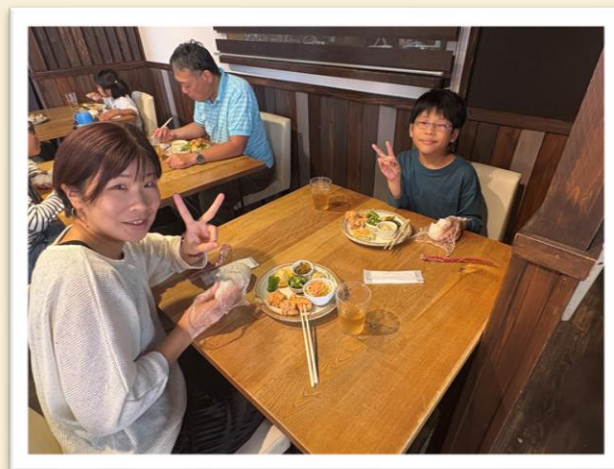
【みんなで楽しく食事をしました】