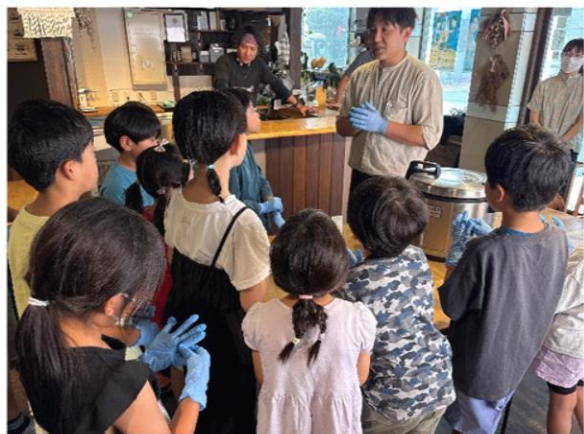
【おにぎりの作り方を聞きます】