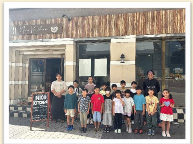
【Niko Kitchen 前でパシャリ】