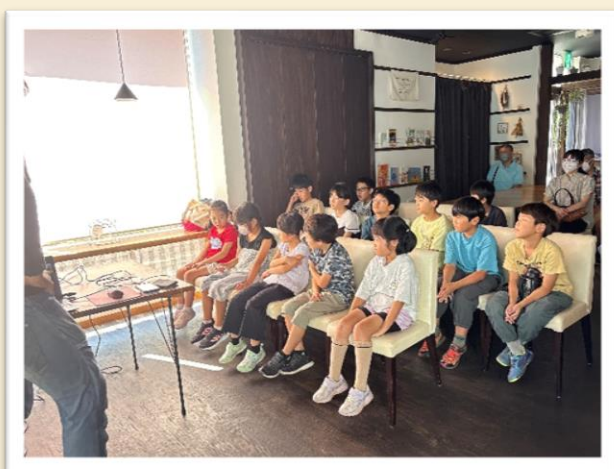
【お米一粒の違いを見てみます】