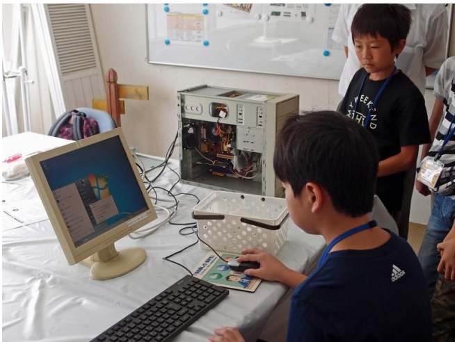
部品装着後の動作確認 (Windows 起動、メモリー容量)