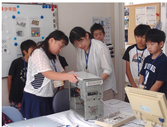
解体調査の始まりです！