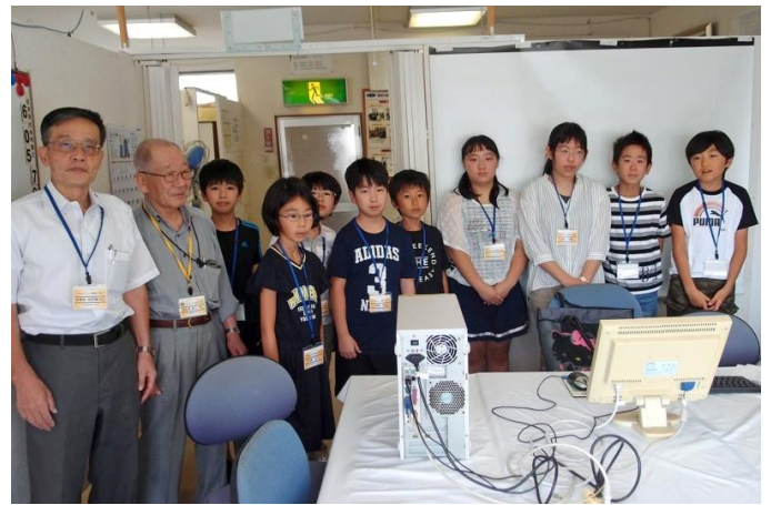
パソコン解体前に復元、正常動作確認 パソコンきちんと動いたよ！ (組立成功の記念写真)