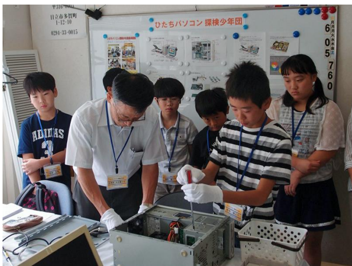
HDD と DVD ドライブ取り外し