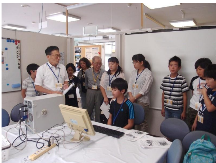
解体前説明と動作確認

デスクトップパソコンを使って、パソコン本体の解体・組立調査を実施しました。最初に動作確認を行ってから、主要部品取り外しなど解体、内部の様子を調査後再び組み立て、動作が正常であることを確認しました。