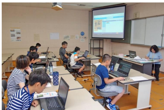
プログラミングのイメージ体験(2) 勝手が判ると、説明なしでも先に進めます!