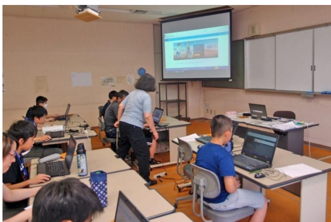
プログラミングのイメージ体験(1) 最初の問題でやり方を説明しました!

最初にプログラムのイメージ体験、「スターウォーズ」「マイクラフト」などゲームを動かしながら、プログラミングの体験をしました。その後で、プログラミング言語の代表例「スクラッチ」を使い、プログラミング練習として「バナナキャッチ」を作成しました。