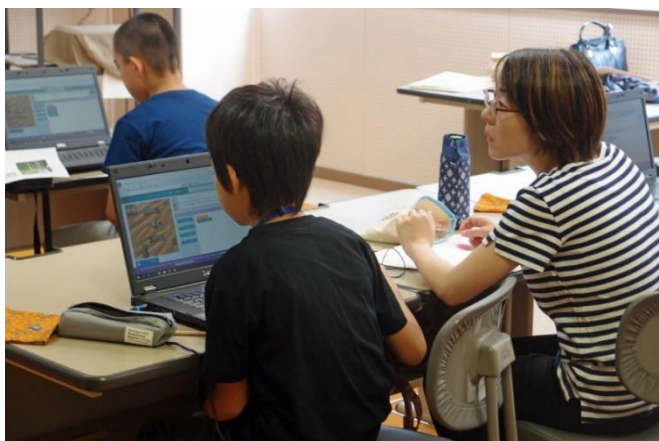
保護者も一緒に、プログラミング体験!