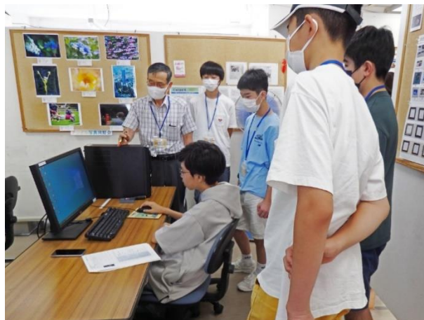
メモリ、HDD 容量調べ方などの説明