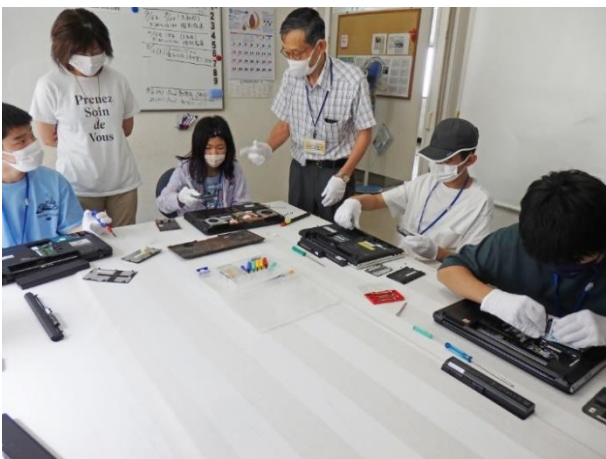
取り外したメモリ再装着