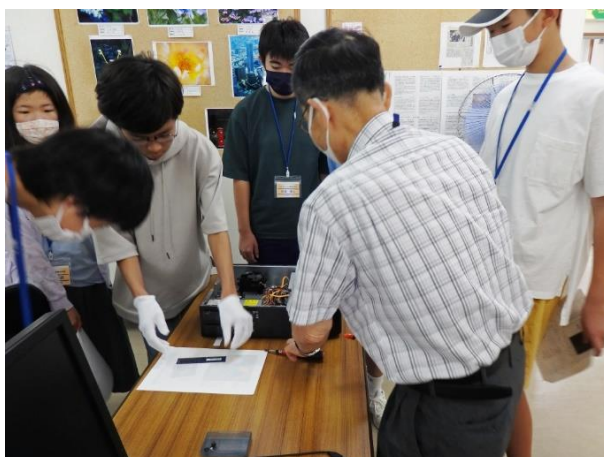
本体内部メモリとSSDの取り外し