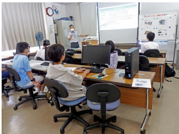
パソコン基本構成などの説明