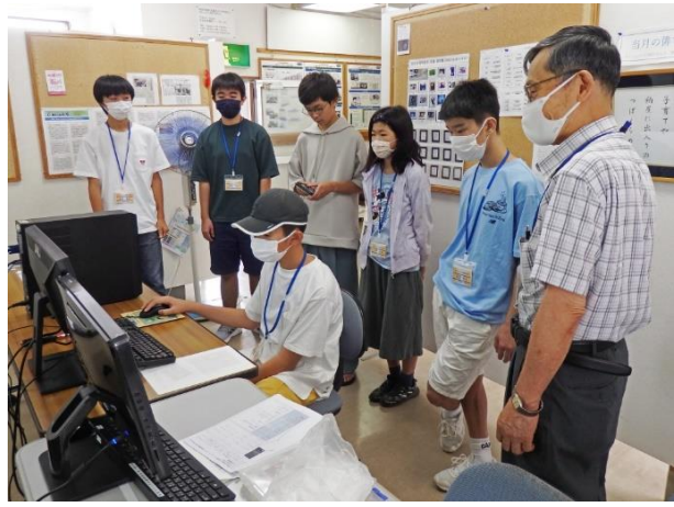
再装着メモリと SSD の容量確認