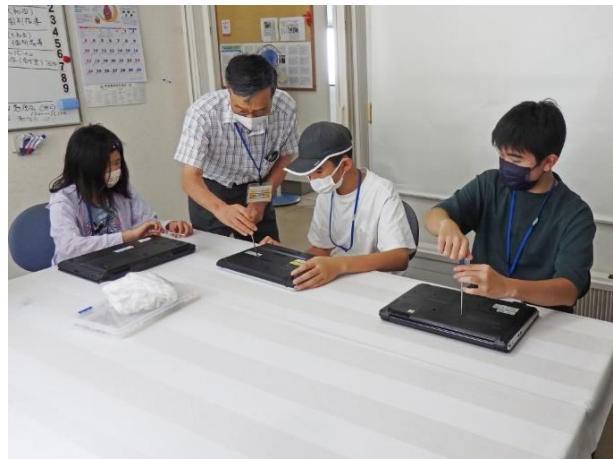
ノート PC のメモリ、HDD の取り外し