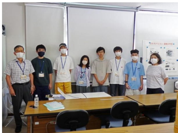
解体、組立体験無事終了の記念写真！

(補習) パソコン解体・組立が早めに終了したので、パソコンを使ってプログラミングの補習を実施しました。