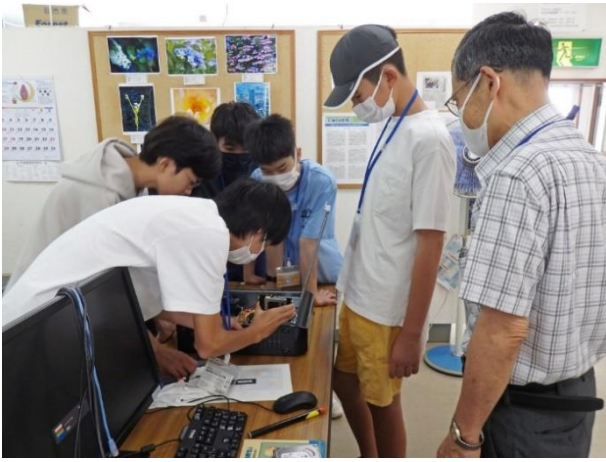
メモリと SSD 再装着