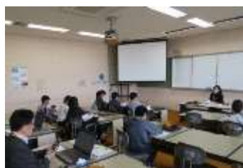
情報検定の講習会