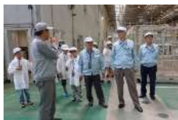
IT企業の製造現場の見学

2019年度は団員8名（小学生8名）が入団、5月19日に入団式、活動前半はパソコンの基本学習、楽しいプログラム作り体験や日立製作所大みか事業所見学などを実施した。後半は「情報検定（J検）」講習会を実施し、情報検定（J検）試験に挑戦して団員7名が受験、5名が見事「J検3級」に合格した。